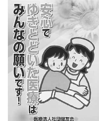
医療法人社団健友会