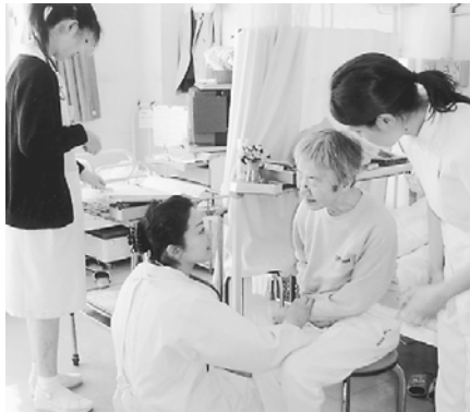
患者さんの話をよく聞いて...

住み慣れたこの街で、安心して療養生活をおくりたいという願いを、何よりも大切にしています。力を合わせて、医療・介護・福祉のネットワークを広げていきたい。そのために、私たちは様々な活動に意欲的に取り組んでいます。たくましく根を張り、花を咲かせるタンポポのように。