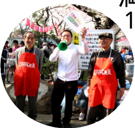
ボランティアも飛び入り