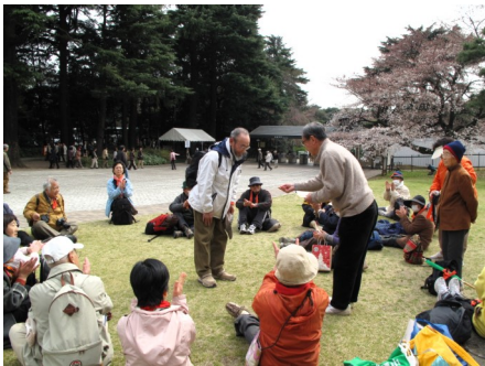
榎本会長から修了証