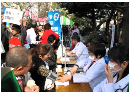
ベテラン医師・看護師の参加で大賑わい

また、会場内で健康測定を行っていた中野総合病院のテナントを訪問し、「地域の方々の健康づくりにお互いががんばりましょう」とエールを交わしていました。