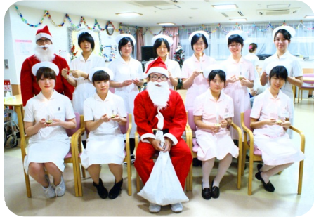
院内クリスマス会

2月からは大学の実習の受け入れも開始します。友の会の皆様にもいろいろとご協力いただきながら、一人でも多くの看護師が当院に入職できるよう、精一杯がんばっていきたいと思います。また、奨学金制度もありますので、看護師・看護学生のお知り合いがいたらぜひご紹介ください。