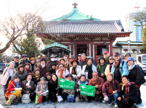
最終地点は上野不忍池の弁天堂

田端駅を出発点に谷中墓地など下町風景を楽しみながら上野・不忍池まで5キロ以上の道のりを、ゆつくりと見て歩きました。初詣を過ぎて七福神に会えないと思っていました。護国院ではお寺の方からはからいで大黒天を間近に見せてもらいました。初めての参加者も多く、「歩けると自信になった」、「寒かったけど来てよかった」、「最後までがんばれた」と感想があり、次回も参加したいと話していました。