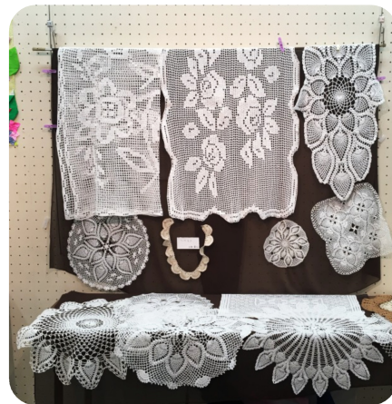
バザー品に寄付されたレース編みが、あまりにも素敵なので作品展に。作者をさがしています。

中野・杉並健康友の会の「作品展」がなかのゼロ美術ギャラリーで行われ、3日間で326人の入場者がありました。 作品約200点が飾られ「毎年作品の質が上がっているように鑑賞するのも勉強になります」「長年作りつづける方々の力強さに感服しました」「幸せなパワーをもらいました」との感想がありました。