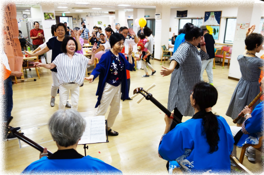
月が出た出た～♪三味線に合わせて踊り出す