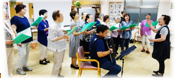
響き渡る歌声で観客と一体に