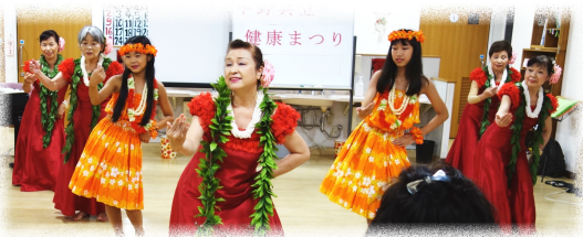
フラダンスサークルは子供たちも!