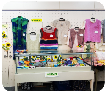
通所リハビリの作品も素敵!