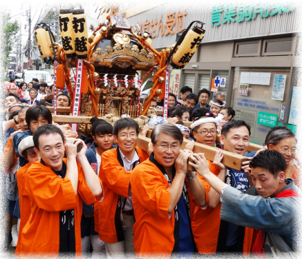
院長も事務長も友の会会長も!