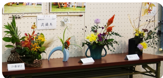
生花に秋を感じました

中野・杉並健康友の会の「作品展」がなかのゼロ美術ギャラリーで行われ、3日間で326人の入場者がありました。 作品約200点が飾られ「毎年作品の質が上がっているように鑑賞するのも勉強になります」「長年作りつづける方々の力強さに感服しました」「幸せなパワーをもらいました」との感想がありました。