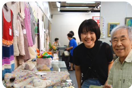
共立の展示の前でいい顔!