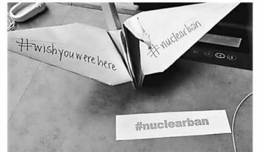
核兵器禁止条約会議不参加ほ日本政府的の席に折り鶴が置かれ、「あなたがここにいてくれたら」の英文メッセージが

私たちが強く願ってきたのは、被爆者を救うと共に人類を救うということです。ピキ二環礁の核実験で使われた水爆は十五メガトンと言われますが、仮に一メガトンの核爆弾が東京タワーの上に投下されたら東京二十三区は壊滅するとのシミュレーションがあります。核戦争が始まれば、地球が雲に覆われる核の冬が訪れて人は住めなくなるとの説もあります。核兵器は人類と決して共存することが出来ない悪魔の兵器なのです。今や国民の八割が戦争を知らない世代となりました。そのために、被爆者は原爆被害の悲惨さを伝える証言活動に重きを置きました。 本年も老体に鞭打ち、核廃絶のために活動を続けます。健友会の皆様のご理解とご協力をお願い申し上げます。