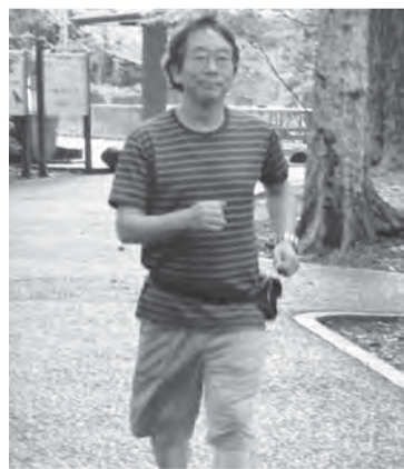
スタートは私の庭「蚕糸の森公園」(杉並)

日は、井の頭公園など都内有名公園まで歩きます。その日の歩数が全国集計され、地図上の距離と順位が毎日わかり、順位を競いエスカレート。気がつくとい日3万歩(約20キロ)も。今回はドイツ編で、現在10万人の参加者の中4位の成績。体重も5kg減。