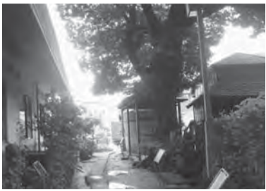
(資料館東脇) 樹齢500年近いシイの木