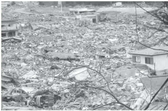
東日本大震災で被災した岩手県田老町

3・11東日本大震災から3ヵ月たったいま、死者1万5400人超、行方不明がなお8100人超で、避難者もまだ9万1000人を超えています。災害史上最大級といわれる大震災の傷は深く続いています。