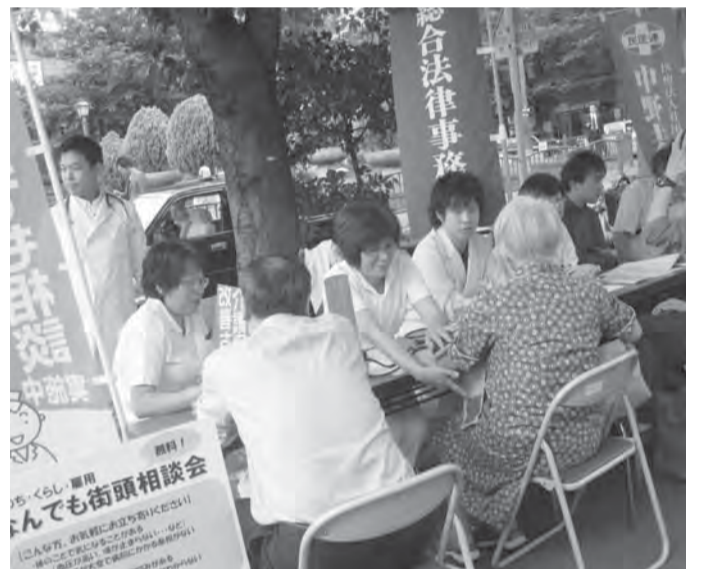
すっかりおなじみの「無料なんでも相談会」、お気軽に!