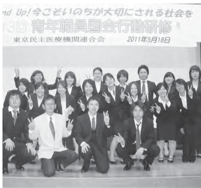
Stand Up!今こそいのちが大切にされる社会を 30 青年職員国会行動研修 東京民主医療機関連合会 2011年5月18日

医療改善に政治の力をと、力強く21人の国会議員(秘書)に訴えました。「今回の取り組みを日常の仕事と重ね合わせ、頑張ります!」。参加者は気持ちを新たにしました。