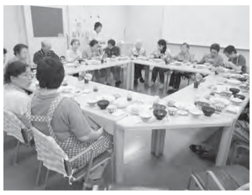
中野共立健康友の会