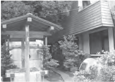
漬物用の大桶と石臼

また、2〜3月には沼袋から江古田にかけて、約百店舗の商店などの店頭や室内で「まちかど雛めぐり」のイベントが行われ、江古田・沼袋診療所でもお雛様を展示しています。ぜひ一度ゆつたりと歴史をご堪能ください。