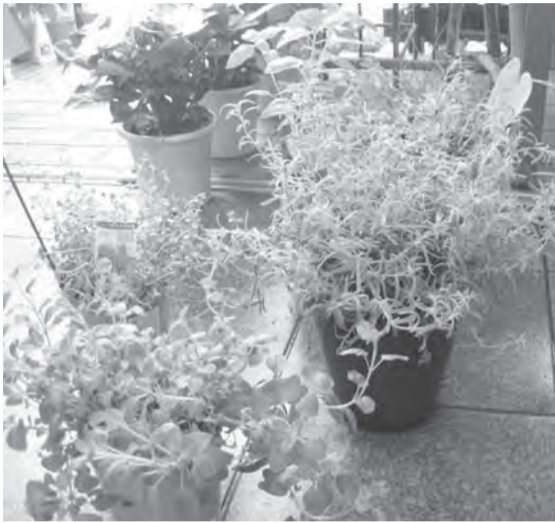
癒しのハーブ、ミント (中野区沼袋2丁目の花屋「花力」で撮影)

ティッシュペーパーに1〜2滴精油を垂らし、デスクなどに置いて、香りを楽しめます。専用器具(キャンドル式・電気式芳香器)を用いれば、より楽しめます。