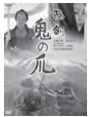
監督「隠し剣鬼ノ爪」に12人の参加。ご夫婦

での参加もあり、すっかり定着した映画会。次回作品に早くも期待が! 終わったあとのコーヒープレイク、話尽きぬ!(長沢)