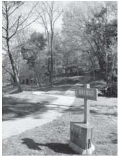
箱根登山口の標識

山登りの出発は高田馬場。ビッグボックスの前を通って右折し最初の信号を左、次の角を右に行くと日本点字図書館。ここから諏訪通りに出て戸山公園へ。元尾張徳川家の下屋敷、昭和29年に開園した都立公園で、大久保地区と箱根山地区に分かれていて面積19万㎡、4000本の樹木が植えられている。スポーツセンター脇から高い木立の小径を歩くと、林の中にある気分。突然、車の往來する道に出る。