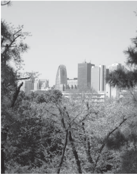
山頂から眺める新宿の景色

正面の学習院女子大とまだ戸山公園。ここでは整備された都市型公園で、花壇、藤棚、せせらぎ、スポーツ広場なども。2時間弱の箱根登山の終点である。