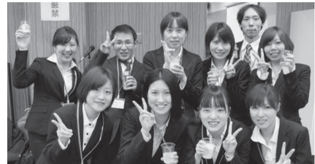
「医療と福祉」主催の4月1日オリエンテーションに参加した新入職員たち

5月15日は、国会議員会館に、東京医連の青年職員が300人近くつどい、実際に議員や秘書に請願行動を行います。「医療・介護現場の実情や患者さんの生の声を一人でも一つでも感じて、直接訴えよう」と張り切っています。(編集部 高村)