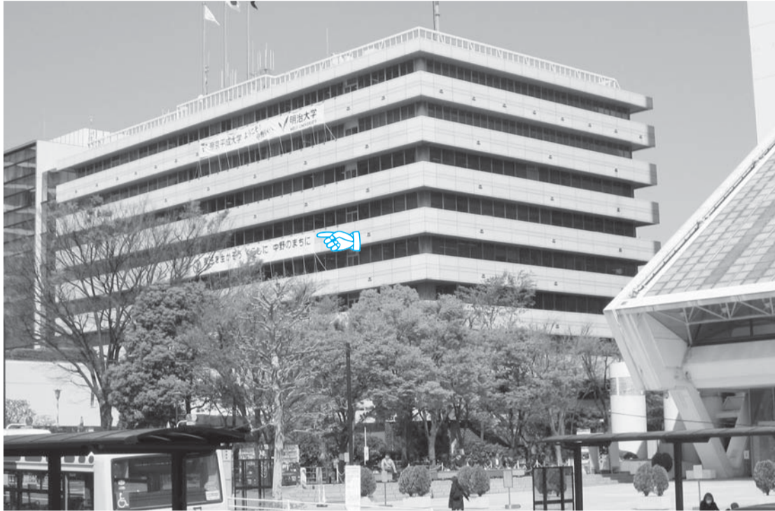
中野区役所に掲げられている憲法擁護の横断幕