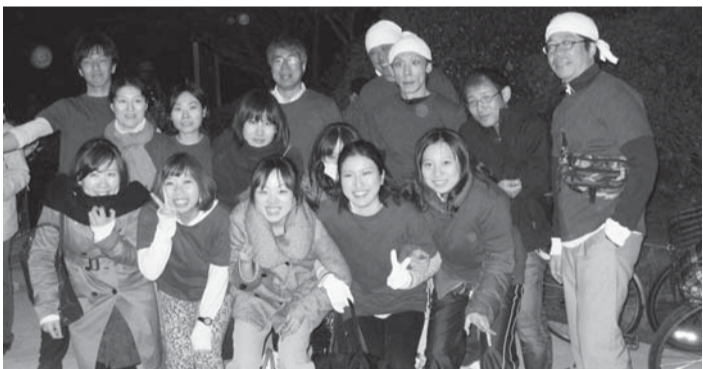
毎週金曜日の脱原発首相官邸前行動。健友会の有志「平和Tシャツ自転車隊」と共に、健友会からプレゼントされた「平和Tシャツ」を着、自転車で「原発いらない」と初参加の新入職員たち