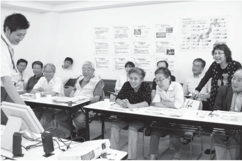
「認知症予防サポート講座」で物忘れチェックを受け、心当たりを笑ってごまかす(´-`)幹事の皆さん

中野共立健康友の会からは、巣鴨信用金庫「年金デー」で年6回の「健康チェック」を行っている報告があり、常連の方も増え、継続して参加している方が前回の健康