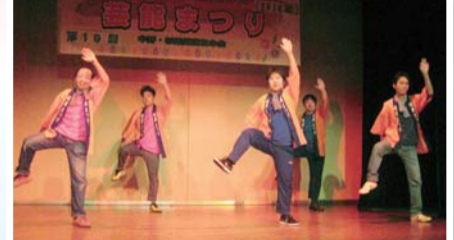
仕事の合間に練習したソーラン節 (職員有志)