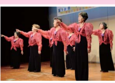
手話ダンス (かわしん健康友の会)

昨年の11月19日、なかの芸能小劇場にて、中野・杉並健康友の会主催の「芸能まつり」が、9つすべての友の会が集まり開催されました。265人の来場者を迎え会場は立ち見が出るほど。26演目の練習の成果が発表され、会場は大きな拍手に包まれました。