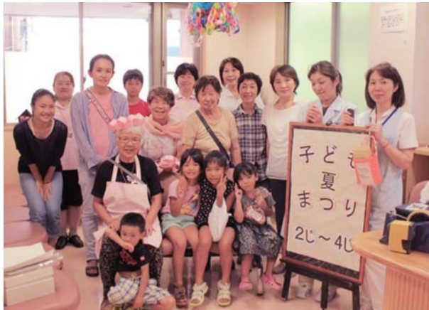
子ども夏まつり 2じ〜4じ

健友会は4年前に、地域に根差した医師を育てる取り組みとして、東京民医連と共に「TMR家庭医療プログラム」を立ち上げました。これは「家庭医療専門医(家庭医)」を目指す研修プログラムになっています。家庭医とは、赤ちゃんから高齢者まで、年齢や性別、病気の種類にとらわれない「総合性」を持ち、継続的できめこまやかに着任したばかりで、わが子も小さく、家庭医療に携わったことがなかったもので自分も指導医として勉強しなくてはならず、プレッシャーが大きかった」と振り返ります。