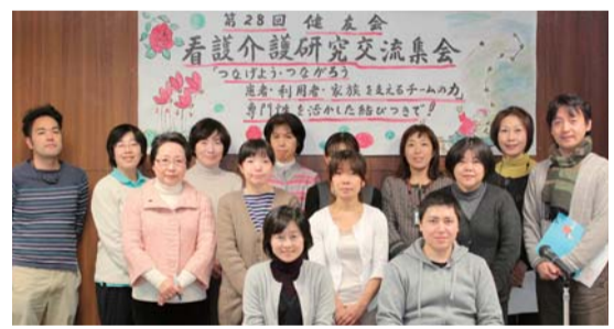
実行委員のメンバー

第28回看護介護研究交流集会が12月10日、東京土建中野会館で行われました。医師、看護師、介護福祉士、ケアマネジャー、薬剤師、事務の職員に加え、友の会の方と総勢79人の参加でした。今回のテーマは「つながりよう つながろう 患者利用者 家族を支えるチームの力」とし、療養指導的、連携事例的、困難事例的、