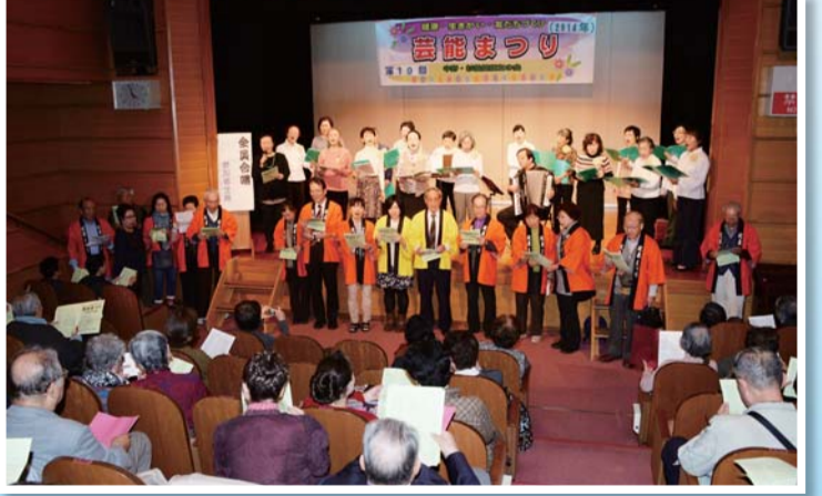
フィナーレ。会場のみなさんと一緒に全員合唱「花は咲く・ふるさと」