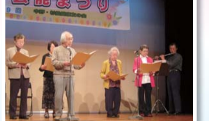
フルートの調べにのせて平和の詩を朗読 (中野共立健康友の会)