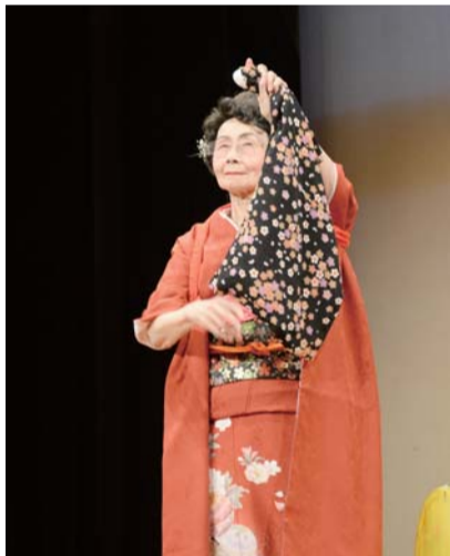
2014年の健康友の会主催「芸能まつり」に参加

昭和29年から荒川区で薬局を経営、都電沿いのいい場所なので、人に貸していますが今も薬局はあります。平成元年に中野に戻