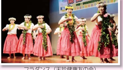
フラダンス (天診健康友の会)