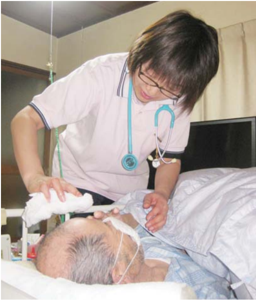
写真は上高田訪問看護ステーションの訪問の様子です。中野在宅ケアセンターのケアマネージャーに聞きました。

Q2 申請のタイミングは? 身の回りのことや家事など、今まで自分でできていた普段の生活がで