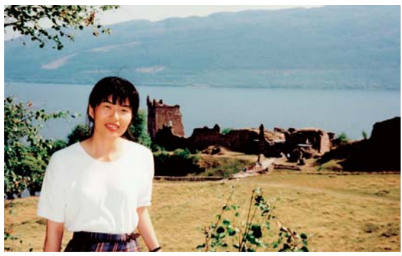
スコットランドにて

かくいう私も、約20年近く前にスコットランドに留学していた。緑の多い、とても美しい国である。もし、機会があればぜひ皆様にも訪れていただきたい。