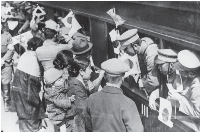
昭和13年、中野駅での出征兵士の激励壮行

乗り、疎開先の家にたどり着いたのは夜の12時。母に報告し長い1日が終りに近かった。「家が焼けちゃった」一言だけ、父に報告し長い1日が終りに近かった。「家が焼け