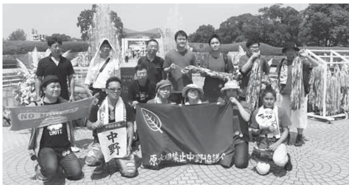
2015年原水爆禁止世界大会(長崎)に健友会・東医研代表として、中野原水協のみなさんと一緒に7人が参加しました。みなさんの平和の思いを繋いだ折鶴を届けてきました。ご支援ありがとうございました。