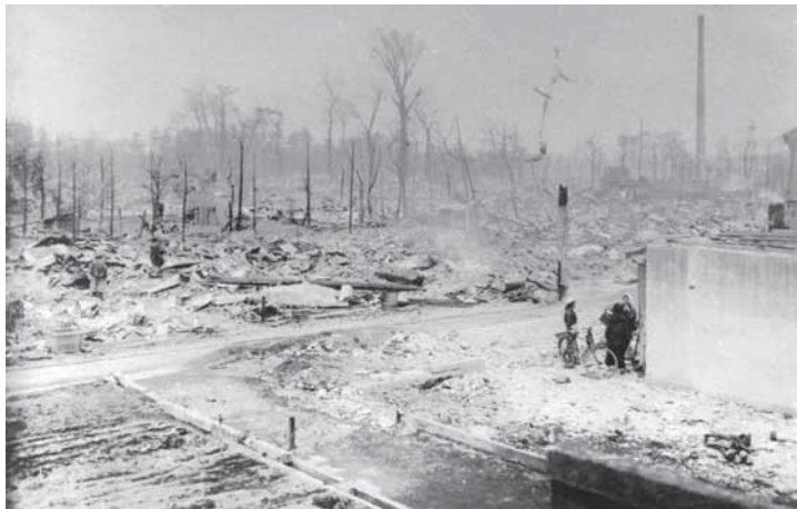
昭和20年5月25日、山の手大空襲の後の新井町付近

当時の私は中学2年生、勤労動員として軍需工場で旋盤を使い、人間魚雷の蝶ネジのネジ切りをしていました。肺炎のため工場を病欠し、広島市から西方10キロの廿日市の実家にいたため直爆は免