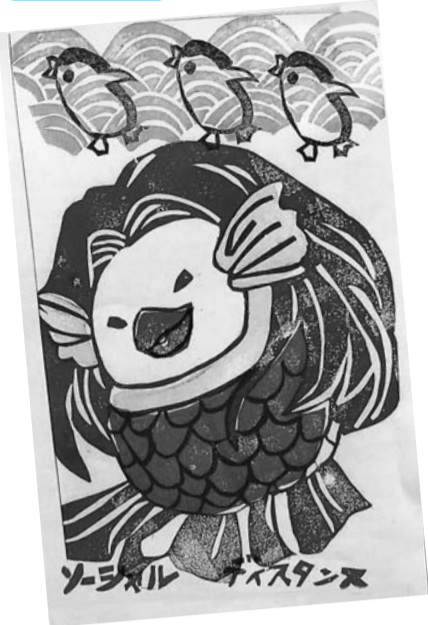
アマビエ 桜山健康友の会 上村 旺司の生徒