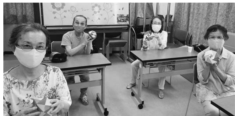
あいだを空けても楽しく

友の会は役員と職員が何度も相談し、8月から活動を再開しました。感染対策として参加者は各回6人まで、検温、消毒、マスク着用を必須としました。コロナ禍以前は、おしゃべり会となると毎回10人前後が集まり、笑い声が診療所内に響いていました。再開後は席を隣どうし空けて、マスクをしなが