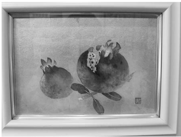
ざくろ ももぞの健康友の会 米倉 笑