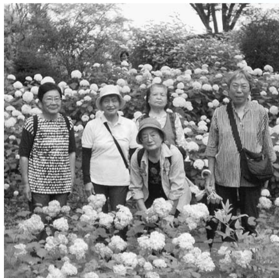
満開のあじさいの前で

新型コロナの中、真夏日が続いた暑い夏は、私たち高齢者にとっては厳しい年となりました。友の会では、3密になるサークル活動を休止とし、5か月近く何もできな