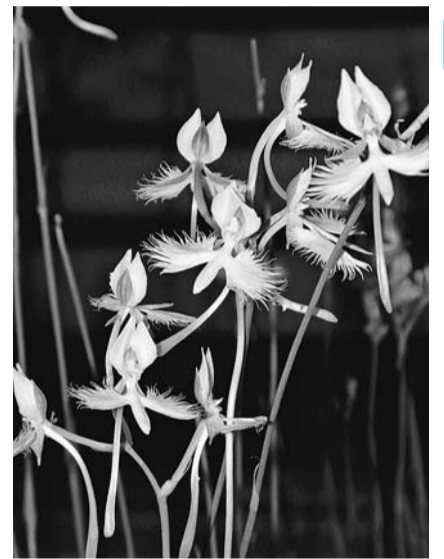
鷺草 共立健康友の会 植木 紘二