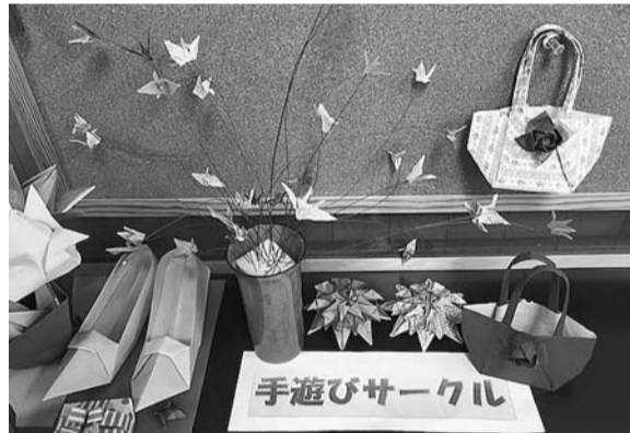
折り紙 西荻健康友の会 手遊びサークル