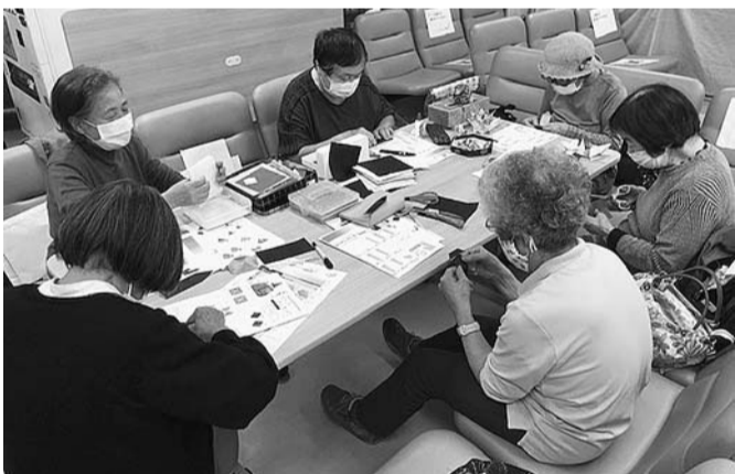
ひさびさの折り紙に夢中

「一日中家の中にいては、足腰が弱ってしまいますよ。やっぱり歩かない」と。これを聞いてから10月の散歩に初めて参加したいという申し出がありました。