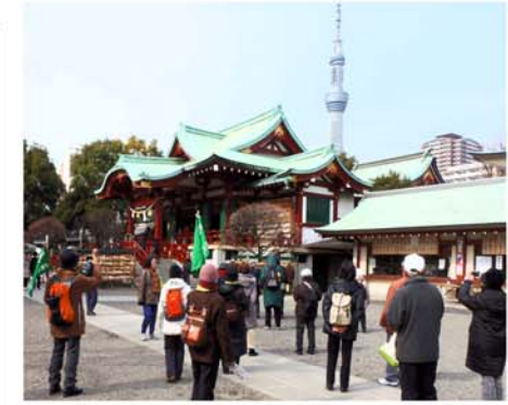
寒さもひとしお、寒梅も咲き始めた亀戸天神、亀戸七福神へ(2/6)。初参加者も多く31人が「のんびり、街の風景や軒下の花々を楽しめた」とスカイツリーを間近に見ながら下町を巡るウォーキングでした。